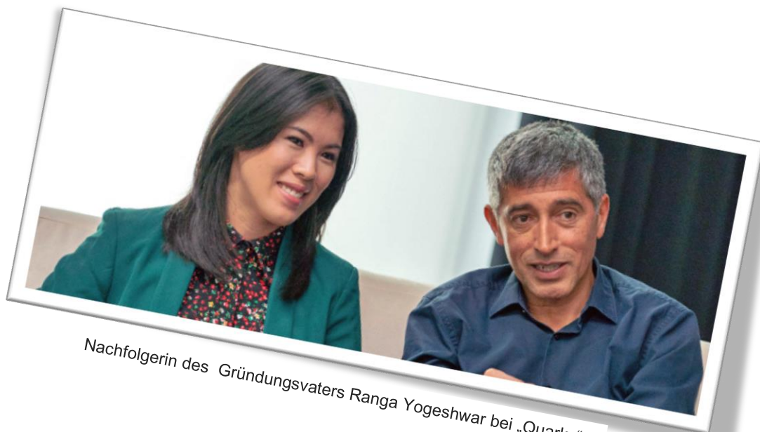
Nachfolgerin des Gründungsvaters Ranga Yogeshwar bei „Quarks“

Wissenschaftlich: Mai Thi Nguyen-Kim – verheiratete Leiendecker - ist eine deutsche Chemikerin, Wissenschaftsjournalistin, Fernsehmoderatorin, Autorin und Youtuberin. Nguyen-Kim, deren Eltern aus Vietnam stammen und in Hemsbach leben, wurde 7.8.1987 in Heppenheim geboren, machte das Abitur im Jahr 2006 am Bergstraßengymnasium Hemsbach. Von 2006 bis 2012 studierte sie Chemie an der Universität Mainz und in USA am Massachusetts Institute of Technology. Ab 2012 arbeitete sie als Doktorandin an der RWTH Aachen, der Harvard University und dem Fraunhofer-Institut für Angewandte Polymerforschung. Sie wurde 2017 mit einer Arbeit über Physikalische Hydrogele auf Polyurethan-Basis an der Universität Potsdam promoviert.